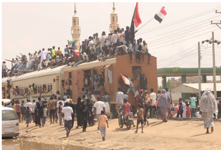
Aus dem ganzen Land strömen Menschen am 17. August in die Hauptstadt, um der Einsetzung der neuen Regierung beizuwohnen.

Drei Jahre soll die Übergangszeit zu einer „Demokratie“ dauern, in dieser Zeit regieren verschiedene Minister*innen und der Souveräne Rat ( Sovereign Council ). Der Souveräne Rat besteht aus 11 Menschen zusammengesetzt aus 5 Militärs, 5 FFC-Ernannten und einem Kompromissmitglied der beiden. Dabei braucht der Rat eine Mehrheit von 8 Mitgliedern für Entscheidungen. Daher