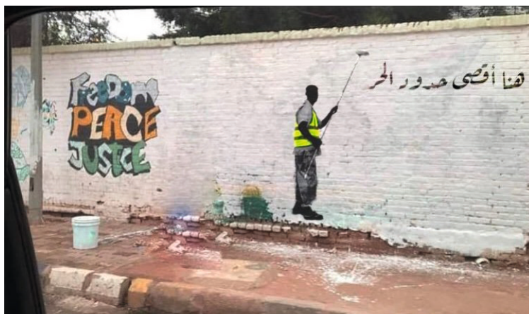
Mitte August begann der TMC revolutionäre Graffiti zu übermalen. Mittlerweile wird dazu aufgerufen, die Wände wieder zu bemalen. In diesem Beispiel wurde die Putzaktion der Regierung kritisiert.

hatte ihn sogar an die Spitze geputscht. Nach einer Weile der Ruhe, kam es nach dem Sturz zu weiteren Protesten, worauf das Militär Anfangs Juni mit einem Massaker an Demonstrant*innen in Khartoum antwortete. Dabei kamen über hundert Menschen ums Leben und es kam auch zu Massenvergewaltigungen und anderen Gewalttaten. Seither gab es fast täglich Tote, vor allem in Sudans Peripherie – und trotzdem blieben die Proteste recht friedlich.