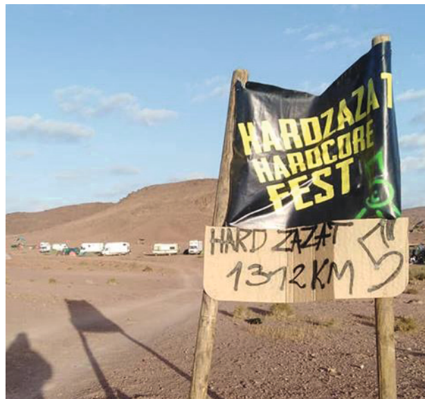
Kein grosses Parisienne-Zelt: Als dem Festival die Location in der Stadt entzogen wurde, wick dies einfach in die Wüste aus.

Während des Festivals selbst machen diejenigen, die ein Auto haben, die Hin- und Rückfahrten zwischen Ouarzazate und dem Festival, um Nahrung und Bier zu bringen und auf dem Gelände richten sich Händler*innen mit ihren Kleintransportern ein.