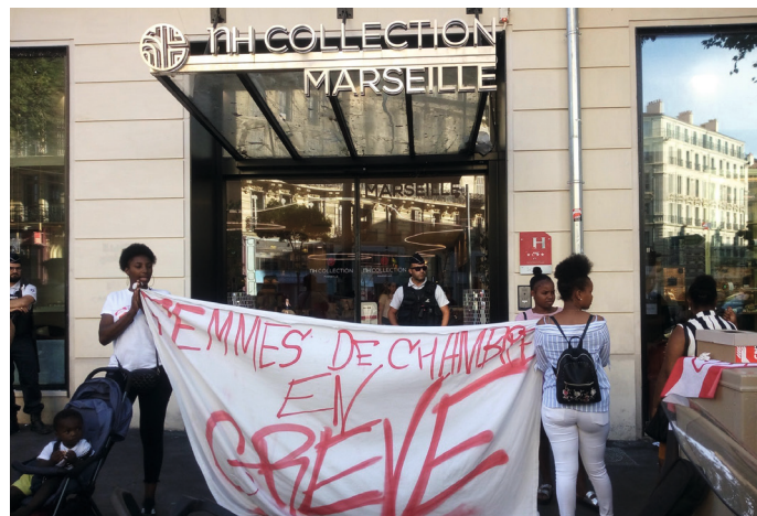
Eine der vielen Protestaktionen vor der Hotelkette NH Collection in Paris. Diese versucht sich durch Subunternehmen aus der Verantwortung zu ziehen.

Misstände nicht individuell sind, sondern in der ganzen Branche vorherrschen. Bald schon war der Frust genug gross, dass sich Las Kellys organisierten und 2017 die ersten Streiks und weitere Arbeitskämpfe anzettelten. Der Kampf der Kellys wird von keiner grossen Gewerkschaft getragen, diesen scheint – wie oft leider auch in der Schweiz – das Leiden der Putzkräfte „zu gering“ zu sein, und auch zu wenig lukrativ. Daher organisieren sich Las Kellys mittlerweile vor allem lokal, auch wenn es jährliche Föderationstreffen, Austausch und Solidarität zwischen den einzelnen Ortsgruppen gibt. Die Bewegung hat es mittlerweile mit ihren Aktionen in die breite Öffentlichkeit geschafft. Und wie auch in Frankreich gelobt die Regierung, nun alles zu tun,