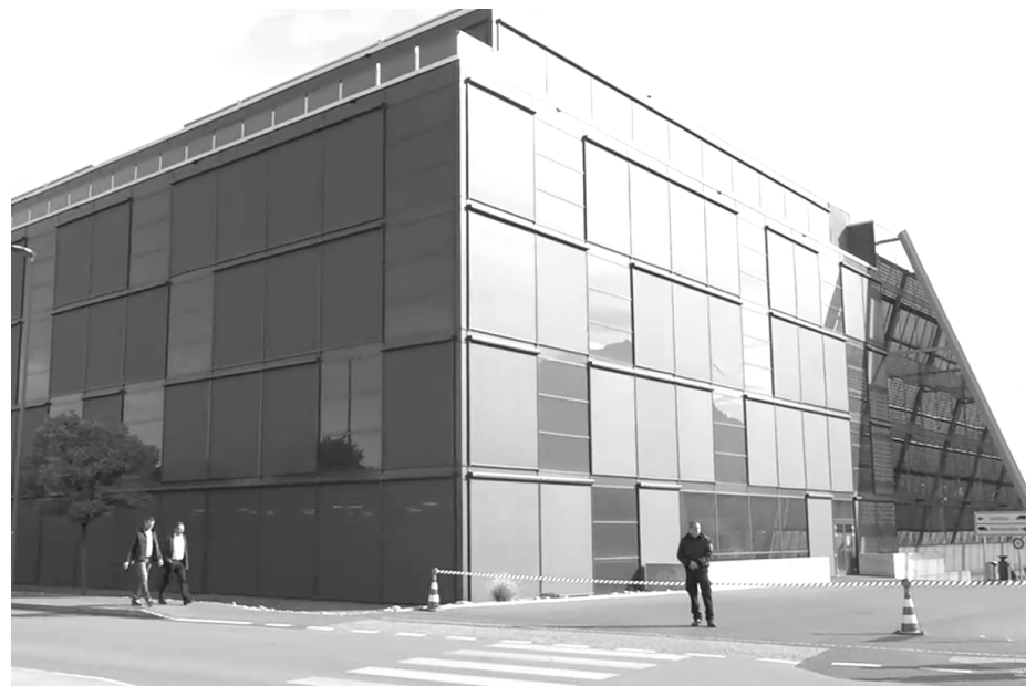
Das abgesperrte und von einer Sicherheitsfirma bewachte Meyer-Burger-Areal in Thun

Die Firmengeschichte begann in den 1950er Jahren als Maschinenfabrikant. Hergestellt wurden Maschinen im Segment der Zulieferer für die Uhrenindustrie. Später spezialisierte sich das Unternehmen auf Spezialsägemaschinen. Nach fast 50 Jahren als Industriebetrieb baute sich die Firma zur Holding um. Damit begann die Expansionsstrategie, global wurden Firmen zugekauft, die pas-