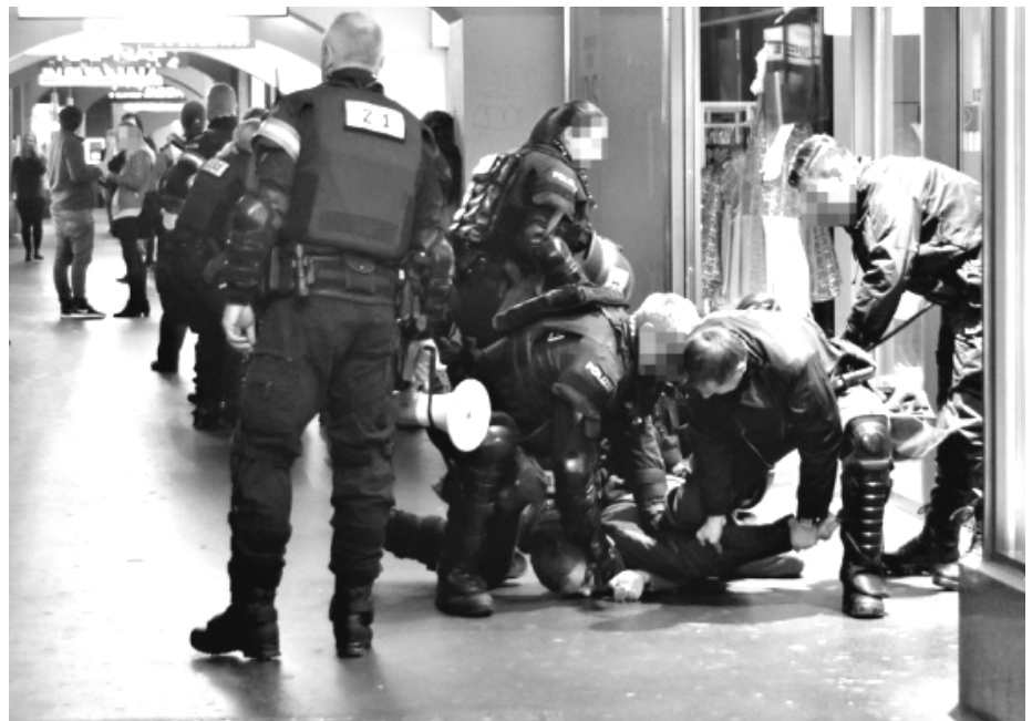
... und 2017. Anderer Anlass, die gleichen Bilder

Die Polizei hat gezeigt, dass sie neue Wege einschlägt. Antifaschistische Mobilisierungen werden mit einem Grossauf-