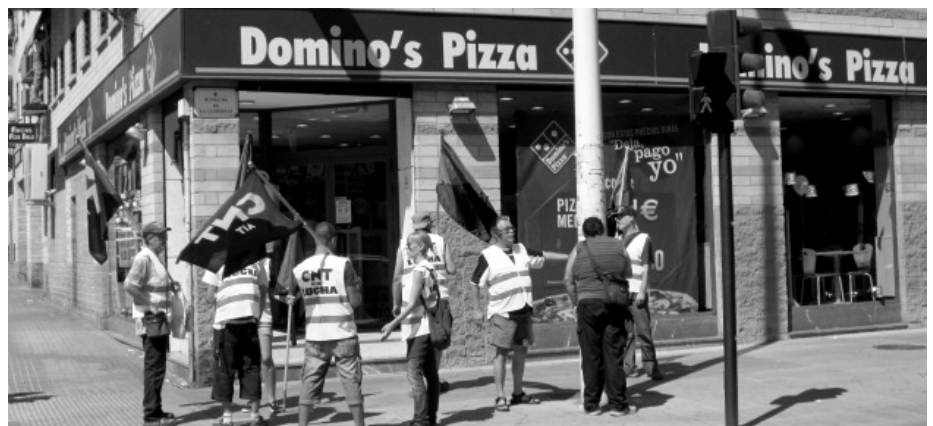
Solidaritätsaktion in Spanien für einen Arbeitskampf in Brisbane, Australien

Wenn du jetzt nicht aufgeben willst, musst du dir schon was anderes überlegen. Was jetzt angesagt ist, ist „Direkte Aktion“, aber das ist, zunächst mal, leichter gesagt als in die Tat umgesetzt. Wahrscheinlich wird es so sein, dass die meisten Kolleg_innen von dir eh schon resigniert haben