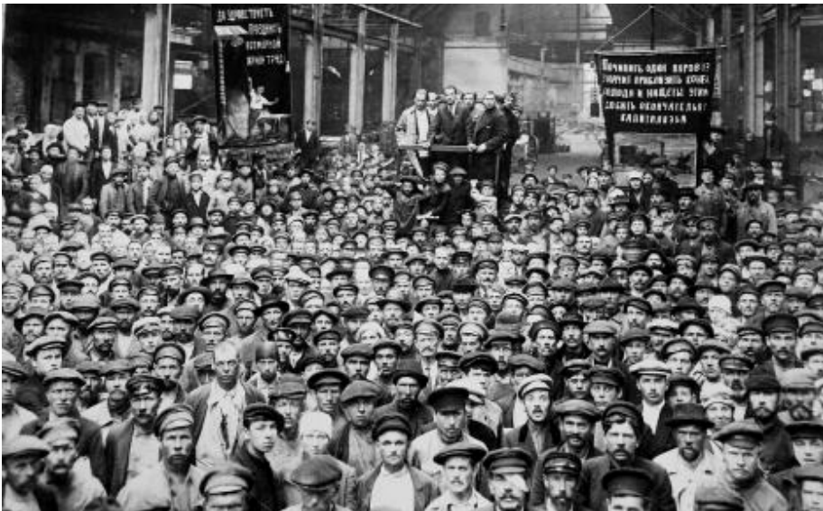
Versammlung der Arbeiter der Putilov-Werke in Petrograd, Juli 1920

Es war also die bolschewistische Ideologie, über deren bevorzugte Strukturen