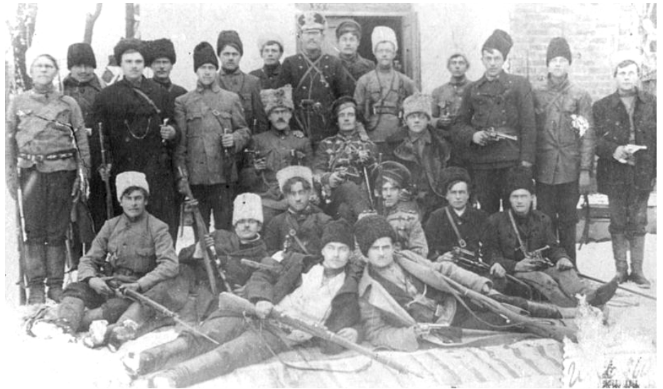
Teil der Revolutionären aufständischen Armee der Ukraine (Machnowschtschina)

Dazu kommt, dass die Repression gegen die interne Arbeiter- und sozialistische Opposition umgekehrt proportional zur Bedrohung war – je näher die Weissen waren, desto weniger Repression, denn die Bolschewist_innen brauchten jeden