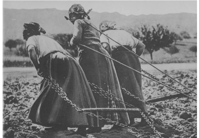
Da sowohl Männer wie auch Pferde eingezogen wurden, müssen die Bäuer_innen selbst den Pflug ziehen. Generell blieb viel Arbeit an den Frauen hängen.

gedacht, Aktionen der SP Schweiz und der linken Gewerkschaften zu koordinieren. Die Idee des Generalstreiks geisterte schon lange durch die Köpfe, wurde mit der Not gegen Ende des Krieges immer aktueller. Schon im April und Juni wurde mit dem Landesstreik gedroht, wenn der Milchpreis steigen sollte. Verhandlungen begannen mit dem Bundesrat, blieben