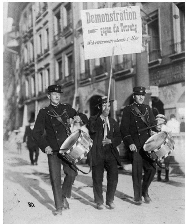
Aufruf in den Strassen gegen die Teuerung. Schon damals war die Schützenmatte Besammlungsort.

So kam von bürgerlicher Seite schon damals der Vorwurf, die Arbeiter_innenbewegung sei von fremden Mächten gesteuert, mitunter auch Vorwürfe mit antisemitischer Färbung.