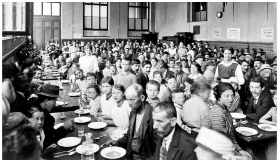
Volksküchen wurden zu einer Notwendigkeit der Arbeiter_innen. Diese wurden vor allem von gemeinnützigen Vereinen, den Kantonen und Städten selbst geführt.

Durch die traditionellen Genderrollen waren oftmals sie zuständig für die Essens-Besorgung, welche durch die Inflation massiv erschwert war. Gerade in armen Familien war es Notwendigkeit, dass auch Frauen und Kinder arbeiten gingen. Durch den Einzug ihrer (Ehe-)Männer – wenn sie denn überhaupt welche hatten – waren sie alleine für die Geldbesorgung, Haushalt, Erziehung und Essen verantwortlich. So erstaunt es auch nicht, dass 1915 der Frauenkongress gegen den Krieg stattfand. Während des Kriegs kam es vereinzelt zu Hungerstreiks. Viel gewichtiger waren die Marktaufstände: So sollen sich verschiedene, vor allem sozialistische Frauenvereinigungen auf den Markt begeben haben und versuchten, die horrenden Preise der Verkäufer_innen zu drücken. Weigerten sich diese, wurden entweder die Körbe umgeworfen und das Essen von den Umstehenden gestohlen, oder aber was viel öfter vorkam: Die Frauen verdrängten die Verkäufer_innen