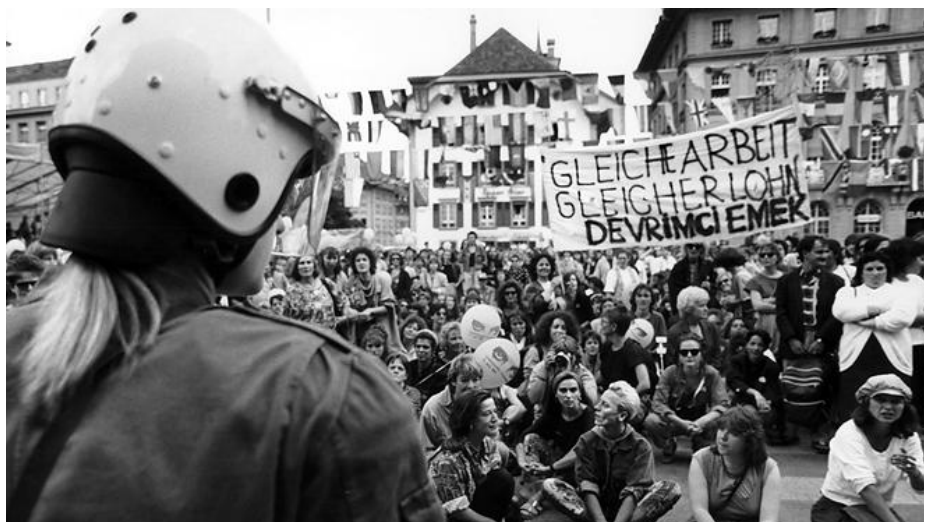
Schon beim Frauenstreik 1991 Thema: Gleicher Lohn für gleiche Arbeit.

Andere Faktoren sind etwa: Humankapital (also wie lange jemand bei einem Unternehmen ist, wie viel Berufserfahrung und Ausbildungen diese Person hat oder wie alt sie ist), ob sie selbstständig erwerbend ist oder wo sie arbeitet (in Zürich sind die Löhne höher als in ländlichen Gebieten).