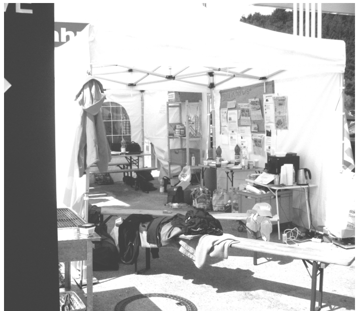
Streikzelt in Dättwil

Der Kampf wurde also komplett von der Unia übernommen und in gut sozialpartnerschaftlicher Manier abgeschwächt, ja beinahe zum Erliegen gebracht. SPAR hat bereits am Freitagmorgen den Shop wieder in Betrieb genommen. Die restliche Belegschaft wird durch Mitarbeiter_innen aus anderen Sparfilialen „unterstützt“. Und für die Entlassenen bleibt nur zu hoffen, dass