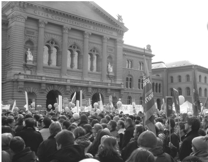
Demonstration des Staatspersonals im März 2013

47% mehr Lohn gab sich der Grossrat Anfang Juni. Zwar müssen neu alle Einkünfte aus der parlamentarischen Tätigkeit versteuert werden, doch am