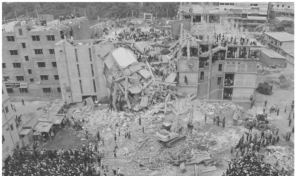
2013 kollabierte die Textilfabrik Rana Plaza in Bangladesch, über 1000 Arbeiter*innen fanden darin ihren Tod. Schon bald standen die Billigmarken wie Primark am Pranger. Doch dass andere „sozialere“ Firmen auch dort produzierten, wurde ignoriert. Dies ist ein Beispiel dafür, dass der „Konsumaktivismus“ nur sehr beschränkt etwas ändert und vor allem als Feigenblatt fungiert.

ein hochwertiges Produkt handelt. Da fragt man dann auch nicht mehr nach den Produktionsbedingungen. Und selbst wenn es stimmen würde, dass ein teures Produkt bedeuten würde, dass diejenigen die es hergestellt haben besser bezahlt werden, was ist dann mit den Menschen, die sich das teure Produkt einfach nicht leisten können? Ist ethischer Konsum wirklich eine politisch sinnvolle Strategie, wenn nur verhältnismässig reiche Leute sie sich leisten können? Oder ist es vielleicht doch nur eine weitere Art, arme Leute zu beschämen – diesmal dafür, dass ihre Unterhosen vermutlich von Kindern zusammengenäht wurden?