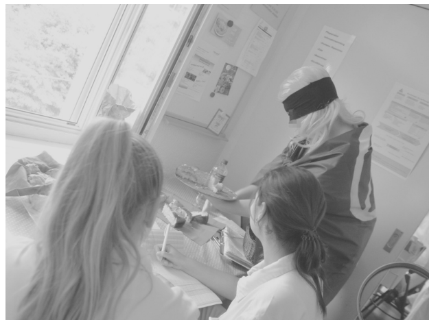
Superwoman besucht jene Frauen*, welche nicht streiken können. Es gibt als Zeichen der Solidarität Kuchen für Arbeitende in der Pflege.

jedoch eher, dass Fortschritte nur dort gemacht werden, wo sich die Betroffenen selbst wehren und organisieren. Die LGBTIQ-Bewegung in den USA errang Erfolge mit den Kämpfen, welche auch von den Stonewall-Unruhen 3 ausgingen. In der Schweiz war es der unermüdliche Einsatz von Feminist*innen, welche das Patriarchat ins Wanken bringen. Die Organisation von People of Color schwächt langsam aber sicher den Kolonialismus in unseren Regierungen und unseren Staaten. Viele People of Color können nicht auf den Staat hoffen, denn dieser schliesst sie oftmals einfach aus der „demokratischen“ Teilhabe aus. Und auch die Arbeiter*innenklasse kann nicht auf Almosen der Bourgeoisie hoffen. Denn die hat es nicht mit Almosen zu ihrem