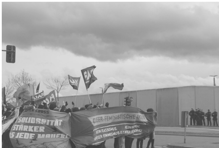
Soliaktion der FAU und GG/BO vor dem Knast. Die Polizei hält sich bereit.

GG/BO: Gesetzlicher Mindestlohn für arbeitende Gefangene; Voller Einbezug