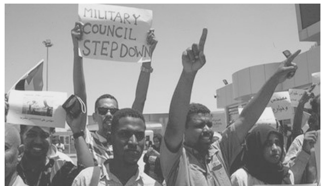
Die Proteste gehen weiter: Nach der Absetzung des Diktators soll nun auch das Militär weg.

unter dem Hashtag #blueforSudan aufgerufen. Damit sollte der Druck auf die westlichen Regierungen erhöht werden, welche dem Regime immer noch die Treue halten. So wurde auf die „Friedenskonferenz“ am 21. Juni in Berlin z.B. Saudi Arabien oder die Vereinigten Arabischen Emirate, Geldgeber des Regimes, eingeladen, jedoch keine der vielen zivi-