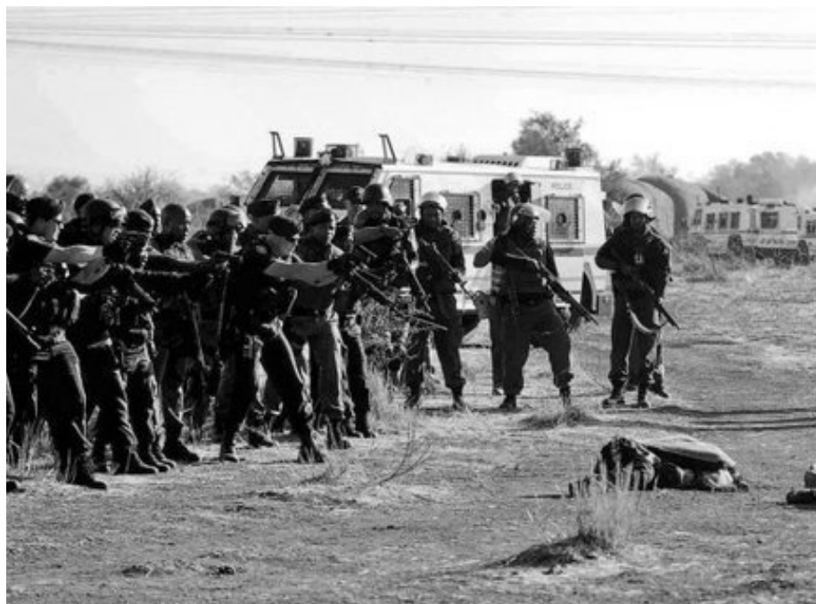
Polizisten zielen auf Streikende

theid ist letztlich doch nicht ganz von der Hand zu weisen, so wurden 270 Kumpel des Mordes an ihren Kolleg_innen angeklagt. Dies geschah über einen Gesetzespassus des Apatheidregimes aus dem Jahr 1956. Damit konnte ein Mob kollektiv für seine Taten belangt werden. Schon beinahe eine absurde Randnotiz ist die Anmerkung, dass einige der Verhaftungen nur gelangen, weil die Betroffenen im Spital lagen, mit Schusswunden von den Bullenknarren.