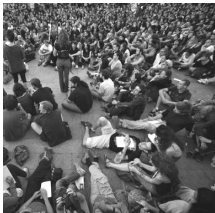
Das assemblarische und das deliberativ-partizipative Modell im Vergleich. Links: Abstimmung einer Vollversammlung, rechts: Diskussion auf dem Weg zur Konsensfindung

einerseits soziale Bewegungen eine „reale Demokratie“, auf der anderen Seite werden mit dem Schlagwort „Demokratie“ aber auch die herrschende Ungleichheit legitimiert – es werden „demokratische“ Volksrepubliken ausgerufen, oder auch mal „demokratisch“ abgesegnete Sparprogramme durchgesetzt. Dennoch kann man den Begriff nicht einfach beiseite lassen. Gruppen, die einen sozialen Wandel anstreben, müssen auch ihre interne Organisation hinterfragen, ihre Vor- und Nachteile diskutieren, damit sie eine Alternative zum vorherrschenden, kritisierten System darstellen. Demokratie bedeutet wörtlich „Herr-