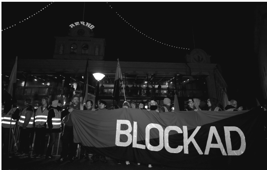
Blockade des Stockholmer Nobelrestaurants Berns

Ende August besuchten zwei Mitglieder der FAU Bern eine seit hundert Jahren kontinuierlich existierende syndikalistische Gewerkschaft in Göteborg.